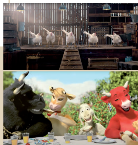
Exemples de publicité Le Gaulois et La Vache qui rit.

en scène des animaux élevés à l'air libre, joyeux, comme s'ils étaient heureux de mourir pour être mangés ! Les exemples ne manquent pas : des poulets qui dansent ou posent fièrement sur une table, des vaches qui rient... Ainsi, en montrant des scènes abruptes en rupture avec l'imaginaire collectif, Erwin Wagenhofer a renforcé l'évidence des faits dénoncés par certains de ses interlocuteurs. Indéniablement, We Feed the World a participé à une prise de conscience aussi persistante que le souvenir de ces tristes images. Vingt ans après, le sujet est passé dans le débat politique et des associations comme L214 Éthique et Animaux, une association activiste française de défense des animaux, fondée en 2008, ont repris ce mode de communication choc.