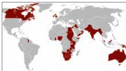
Carte de l'Empire britannique en 1921, à son apogée, juste avant le traité anglo-irlandais de 1921 ; Churchill et de Gaulle durant la Seconde Guerre mondiale.